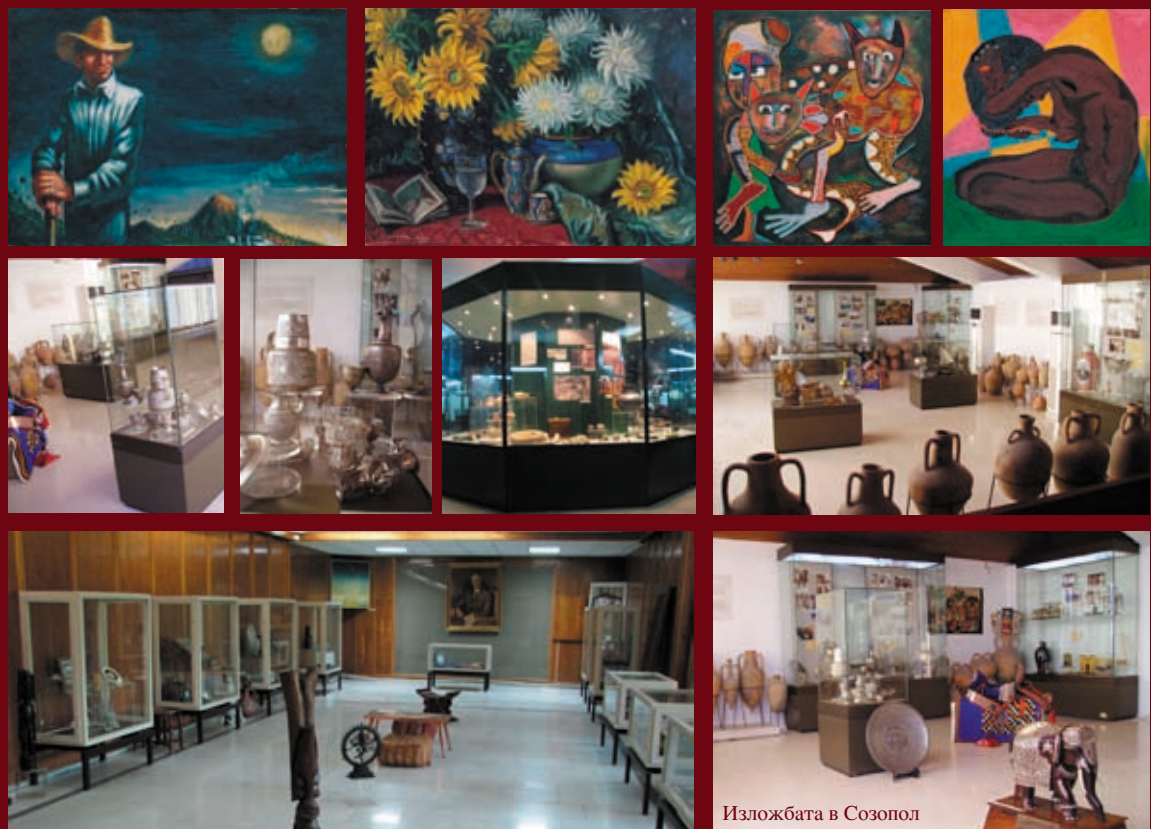
Изложбата в Созопол

През 2002 г. ОбС на Община Правец предоставя на ИМ-Правец "Приемна сграда Правец", превърната понастоящем в Музеен комплекс, разположен в живописна паркова среда. В експозиционната зала е представена част от колекцията подаръци на Тодор Живков. Музейния комплекс се включва и родната къща на Т. Живков, която също е отворена за посетители. Къщата е реставрирана през 1974 г. Представява късновъзрожденска, балкански тип къща на два ката /етажа/ — архитектурна и етнографска възстановка. Това е място за многообразна и многопосочна експозиционна и информационна дейност, където се представят различни по характер изложби — археологически, етнографски, исторически и художествени.